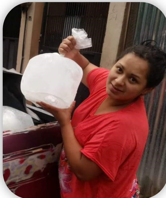
Nidia säljer is till andra företagare som behöver det för sina verksamheter. I Suyapa är både rent vatten och is en bristvara.